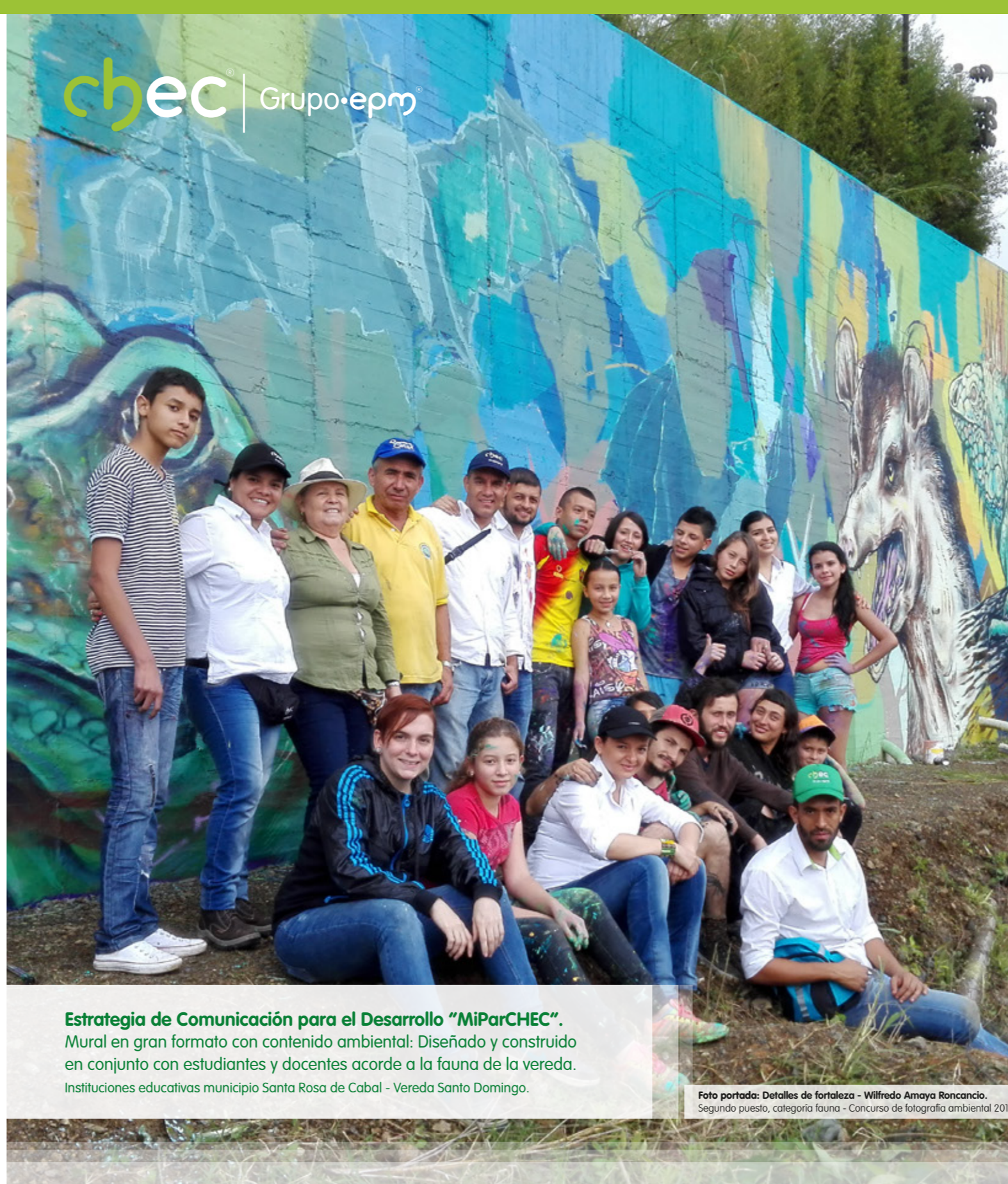
Estrategia de Comunicación para el Desarrollo "MiParCHEC". Mural en gran formato con contenido ambiental: Diseñado y construido en conjunto con estudiantes y docentes acorde a la fauna de la vereda. Instituciones educativas municipio Santa Rosa de Cabal - Vereda Santo Domingo.